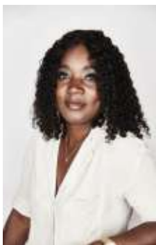
Armeland Animatrice midi et soir 6-12ans